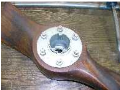
Original Otto Propellernabe