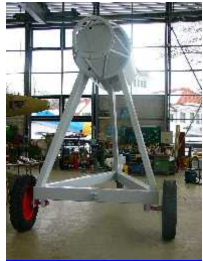
...und aktuell nach ersten Restaurierungsarbeiten

Zwischenzeitlich wurde der Prüfstand vom Rost befreit und wird bald in seiner ursprünglichen gelben Lackierung den