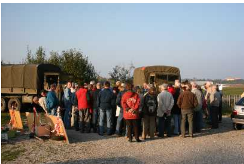
zwei echte U.S.-Trucks, sie gehörten in Oberschleißheim viele Jahre zum Straßen- und Flugplatzbild

pro Jahr statt. Dabei kommen wechselnde Routen zum Einsatz, um die Teilnehmer an ein möglichst breites Spektrum von Relikten aus der Flugplatzgeschichte zu führen. Alle Routen beginnen an der Flugwerft und enden am Biergarten. Seit der ersten Wanderung vor 7 Jahren ist die Teilnehmerzahl dabei stetig gestiegen. Dieses Mal ließen sich nahezu sechzig Menschen die Geschichte des Platzes erläutern. Dies ist sicherlich auch Ausdruck eines steigenden Bewußtseins der Schleißheimer für