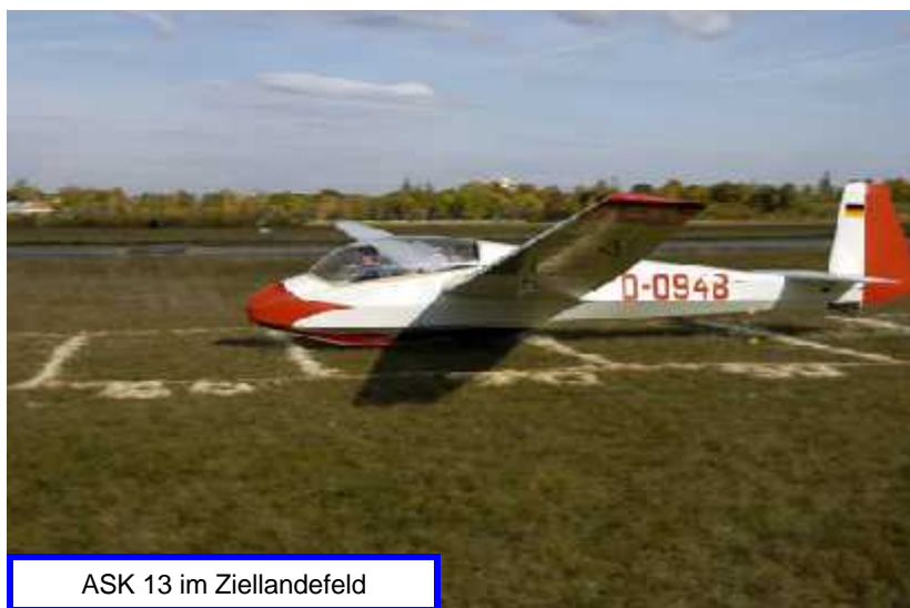
ASK 13 im Ziellandefeld

Den Vogel schoss dann noch Florian Tauss ab, der nach einem Trainingsflug mit der LO100 bei der Landung genau auf das Feld 100 und den Luftballon traf. Dies ist deshalb so bemerkenswert, weil das Flugzeug keine Störklappen und damit keine Aerodynamischen Hilfsmittel für die Landung hat. Ludwig Fuß