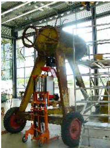
Urzustand im Sommer 2005...

Er könnte amerikanischen Ursprungs sein, muss aber nicht. Sicher ist, er war als