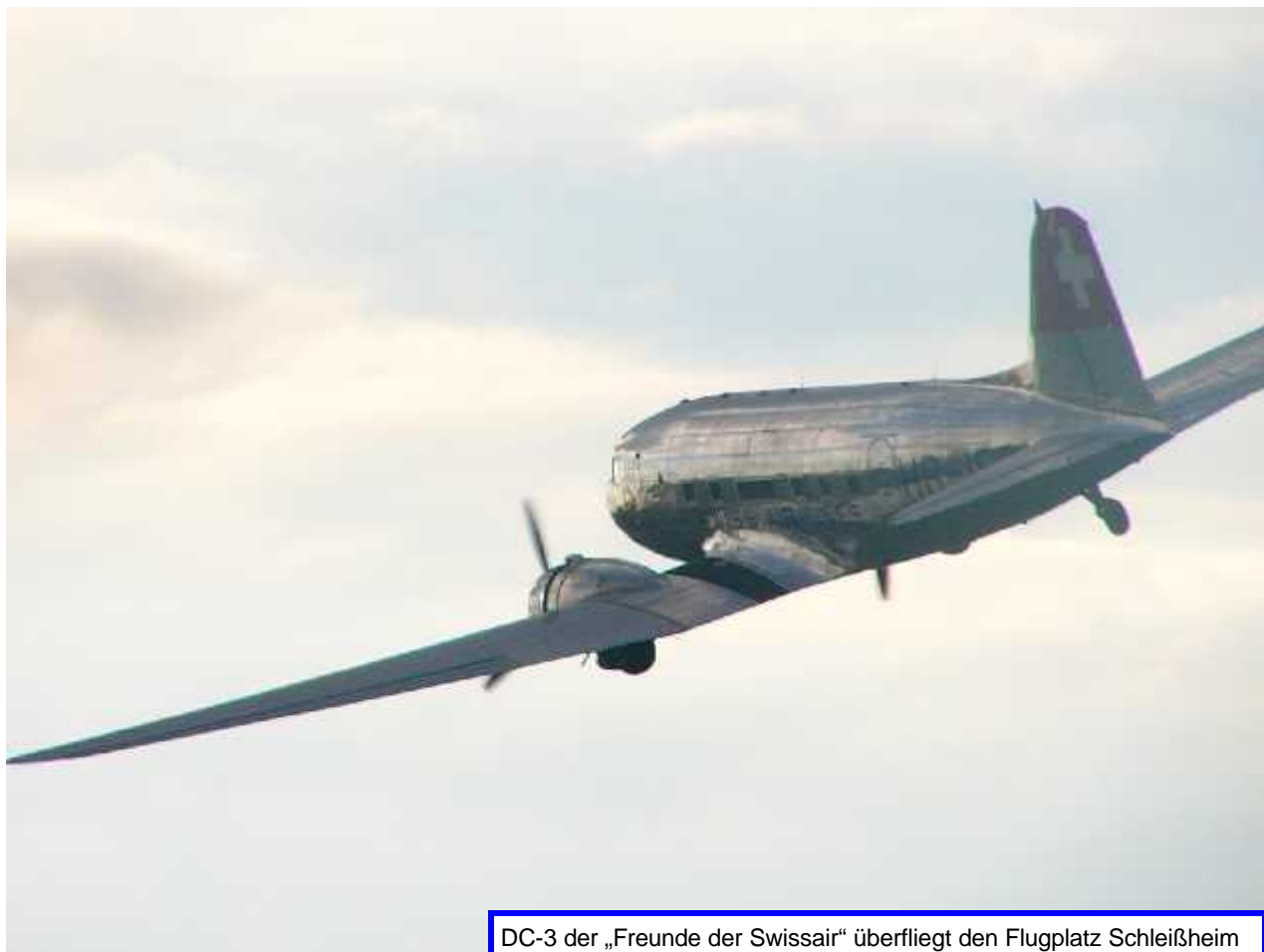
DC-3 der „Freunde der Swissair“ überfliegt den Flugplatz Schleißheim